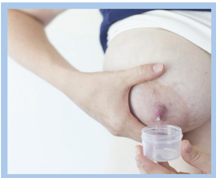
Pagpapalabas ng gatas sa pamamagitan ng kamay ng ina