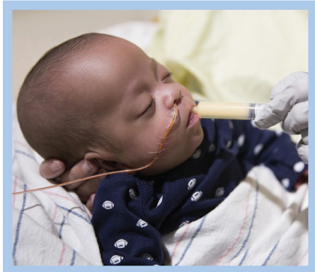
Sereng ki ranpli ak kolostwòm